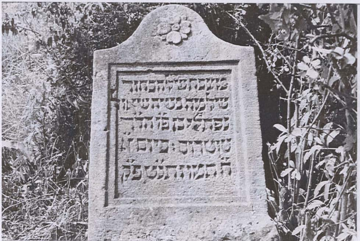
"Grabmal des Junggesellen Schlomo Mosche Schaul Naftali, Sohn des Versorgers und Vorstehers, des Herrn Rabbi Totros, [verschieden] am Sonntag, dem 8. Tamus 459 nach der kleinen Zählung" (5. Juli 1699)