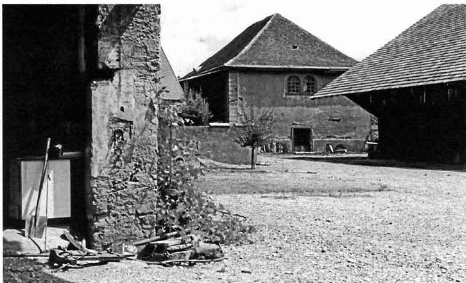
Das seinerzeit an den Vater der heutigen Eigentümerin veräusserte Synagogengebäude diente bis 1992 als Getreidespeicher. Eine Rettung des vom allmählichen Verfall bedrohten Gebäudes ist leider nicht zu erhoffen.